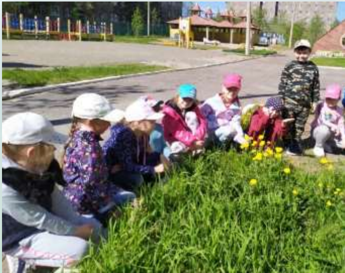
Рассматривание цветов их строение