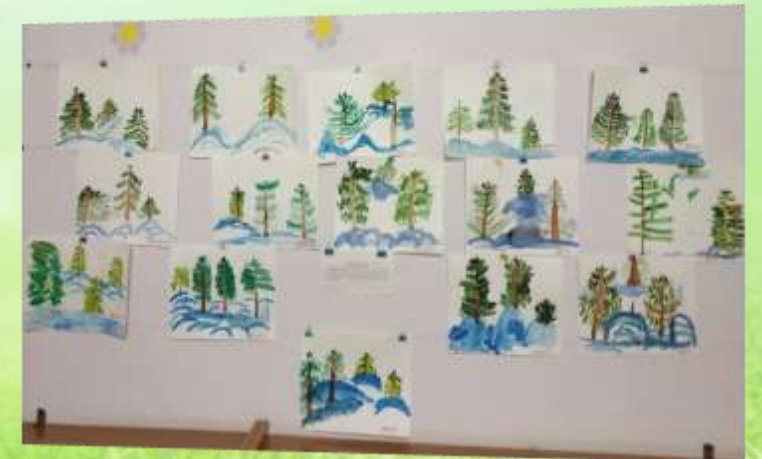
«Зима в еловом лесу»