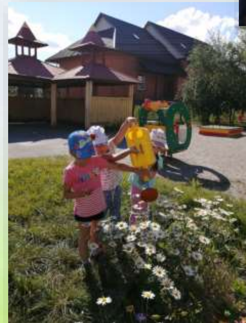
Наблюдение за ростом цветов и уход за ними