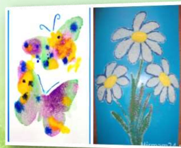
Рисование солью, манкой