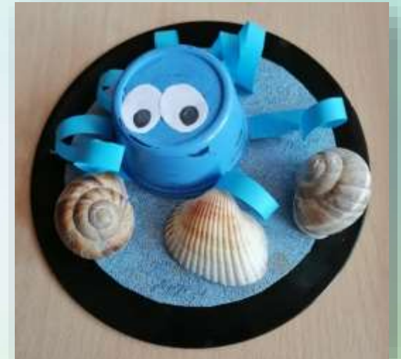
«На дне морском»