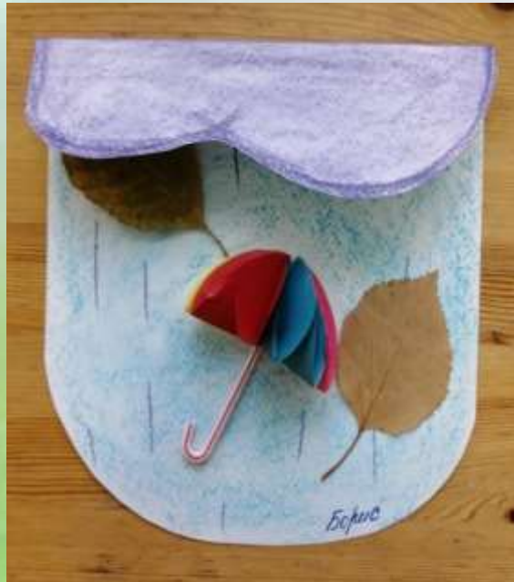
«В дождливый день»