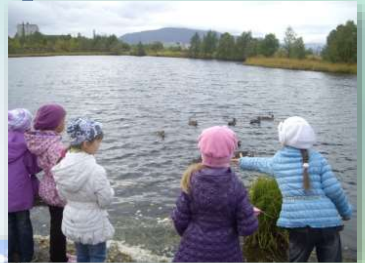
Наблюдение за утками