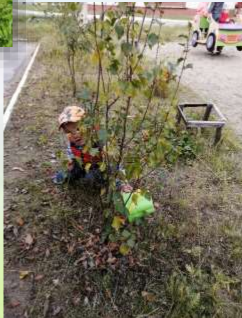
Наблюдение за опавшими листьями