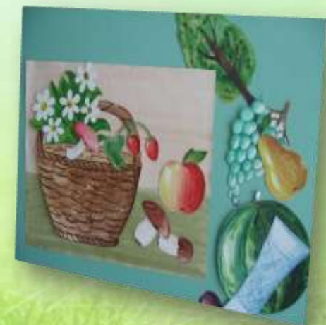
Игра «Собери натюрморт»