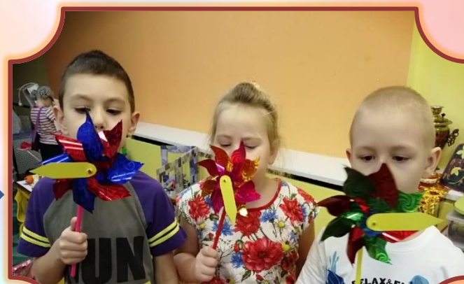
старшая гр. «Ассоциации»