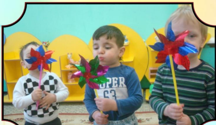
Младшая гр. «Вертушка»