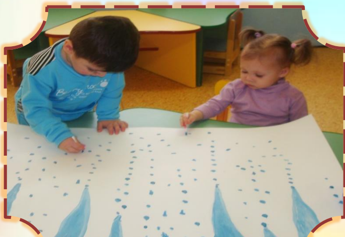
Младшая гр. «Капель»