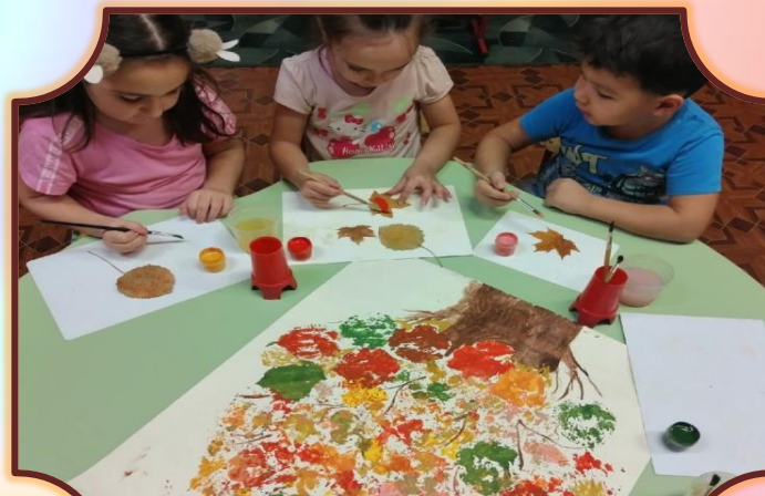
старшая гр. «Настроение Осени»